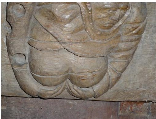
Montrant ses fesses

On distingue des masques grimaçants, des personnages contorsionnés, des animaux monstrueux représentant certaines vertus théologiques ou péchés capitaux. Par exemple la tête avalant ou crachant des feuilles symbolise le renouvellement de la nature. La débauche humaine est, elle, illustrée : par un homme montrant ses fesses ou tirant la langue, des bouffons dansant ou tenant une marotte garnie de grelots. Les motifs animaliers représentent des porcs, des oiseaux ou des taureaux. Les représentations végétales sont des feuilles d'acanthé, de chêne avec leurs glands et des fleurs.