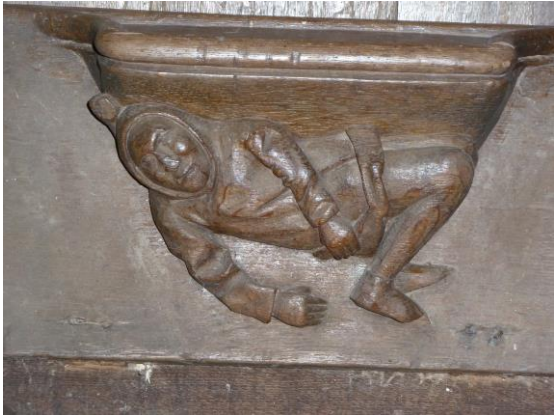
Le contorsionné grimaçant