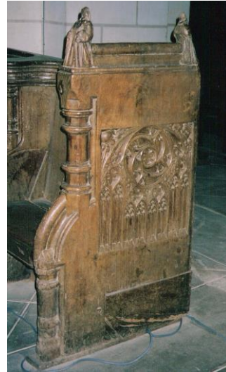
Panneaux de revers stalle de gauche et droite