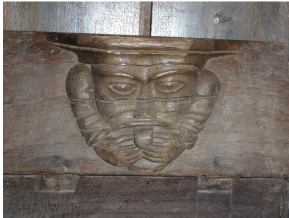
Tirant la langue