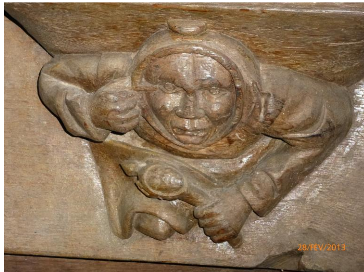
Le Bouffon et sa marotte