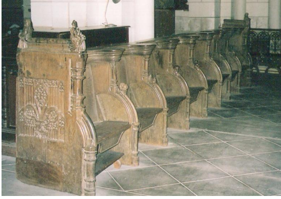
Stalles de gauche