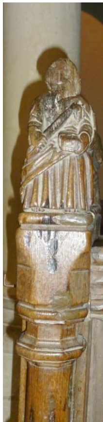
Statutette extrémité de rangée