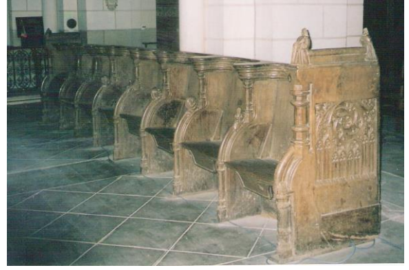
Stalles de droite